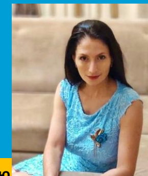
Менеджер по развитию